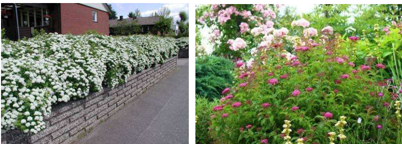
Kvetoucí živé ploty oživující prostor (mochny, ořechoplodce, tavolníky)