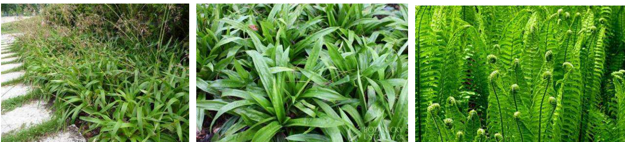
Záhony stinných a poléhavých trvalek kolem kostela