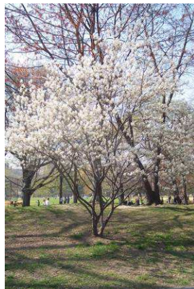
Mnohokmenné muchovníky - solitérní keřové stromky