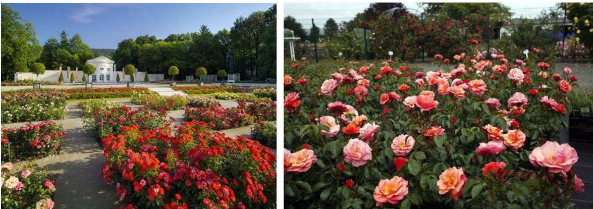
Záhony mnohokvětých růží.