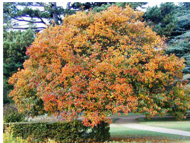
Aleje malokorunných stromů - javory babyky, kulovitá střemcha, barevné podzimní hlohy