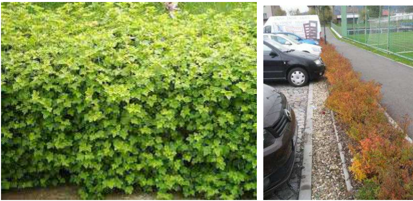
Vymezující živé ploty - meruzalka Ribes alpinum a oživující tavolníky Spiraea japonica .