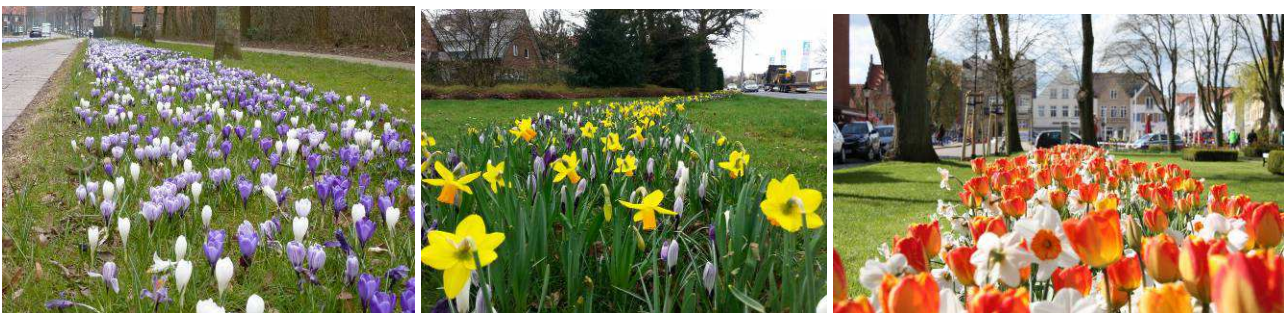
Jarní aspekt v parku - mechanizovaná výsadba cibulovin