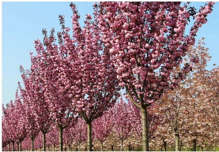
Kvetoucí aleje malokorunných stromů, s drobnými plod, červenolisté třešně