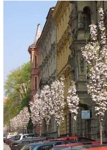
Aleje malokorunných stromů, oživení prostoru - kulovité višně, úzkokorunné třešně