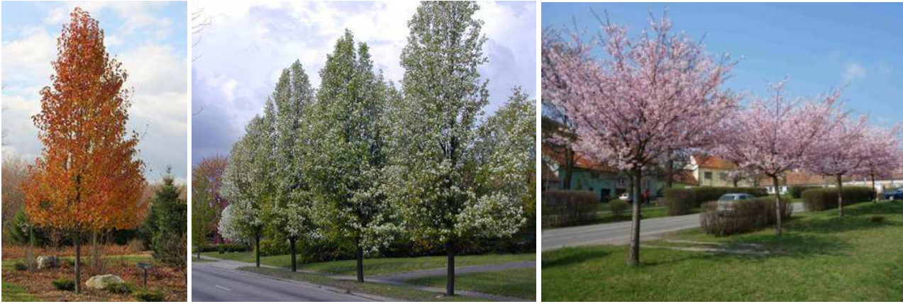
Výrazně kvetoucí stromy (okrasné hrušně a třešně).