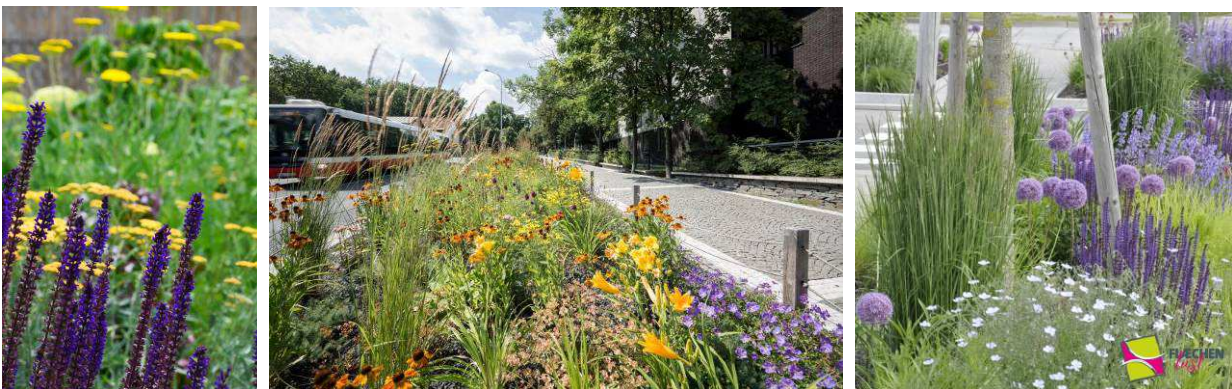
Ukázka slunných trvalek a trav s jarními cibulovinami